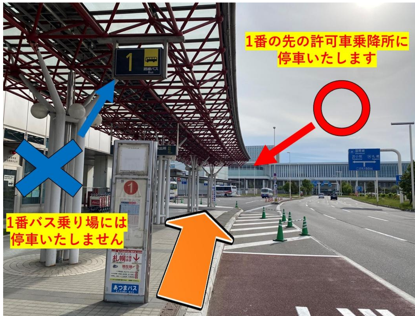
< 許可車乗降所(南側) >