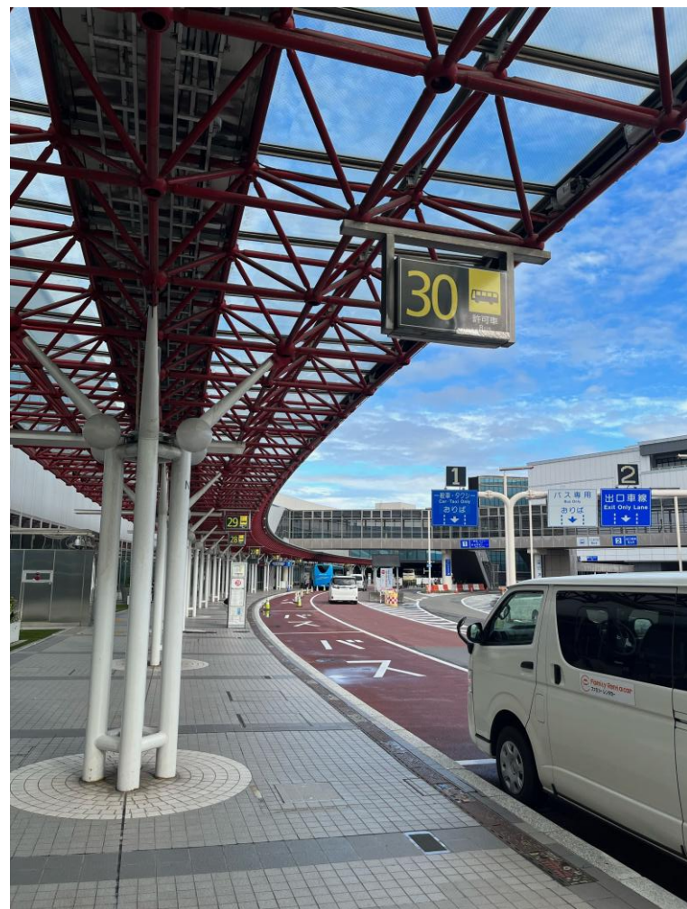
< 30番バス乗り場 >